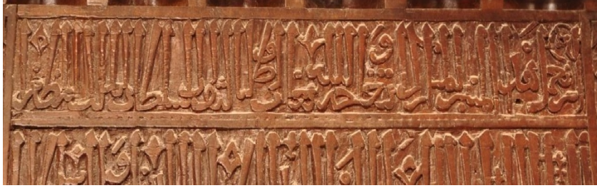
Mardin Ulu Camisi minber kitabesi