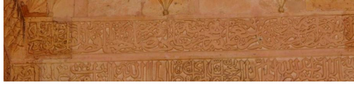
Kitabenin güney kısmı