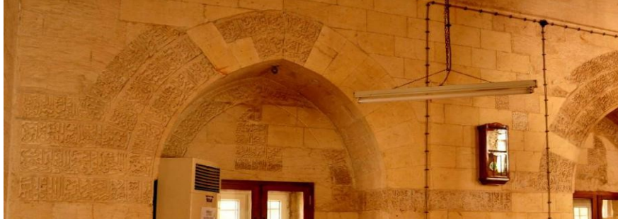
Resim 118: Kitabeden genel görünüm