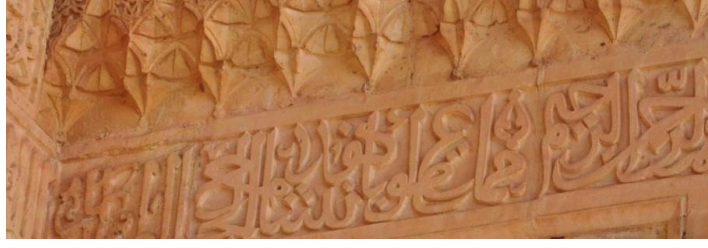
Kitabenin kuzey kısmı Kitabenin kapı alınlığında bulunan kısım